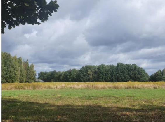
Działki pod zabudowę mieszkaniową jednorodzinną