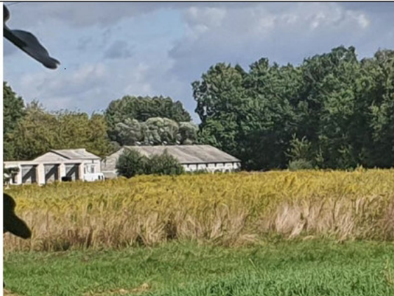
Działki 390/7 i 390/8 (zabudowane)