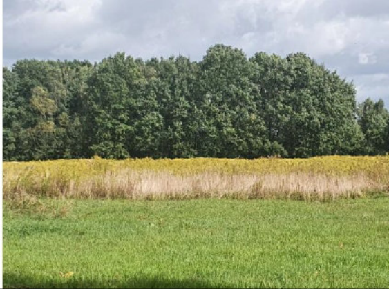
Działki pod zabudowę mieszkaniową jednorodzinną