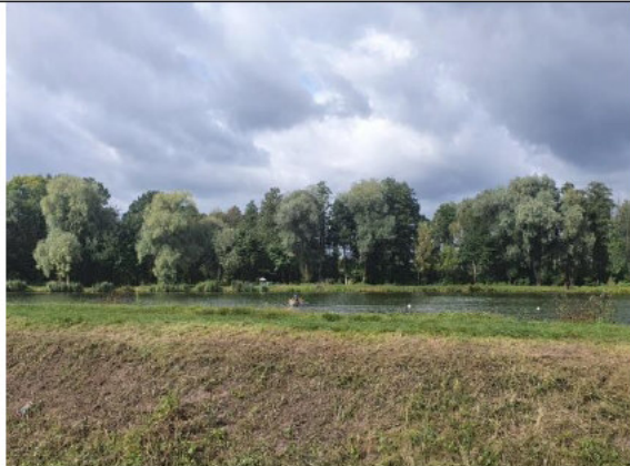
Działka 390/6 (staw hodowlany)