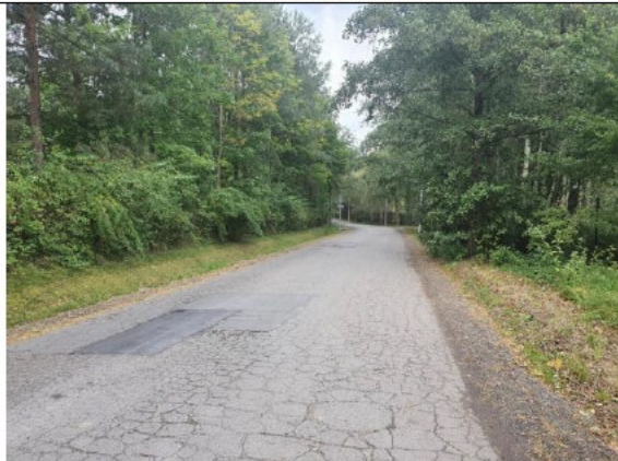
Działka drogowa (ul. Główna)