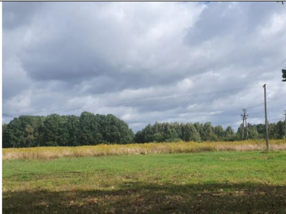
Działki pod zabudowę mieszkaniową jednorodzinną