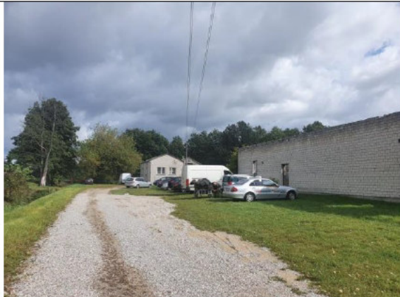
Działki 390/7 i 390/8 (zabudowane)