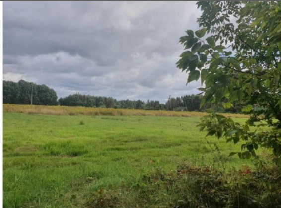
Działki pod zabudowę mieszkaniową jednorodzinną