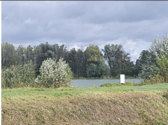
Działka 390/6 (staw hodowlany)