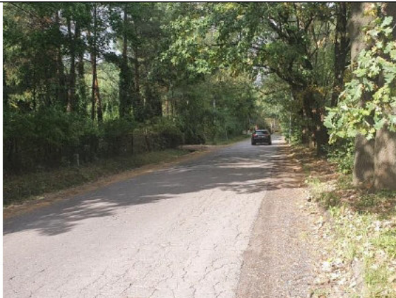
Działka drogowa (ul. Główna)